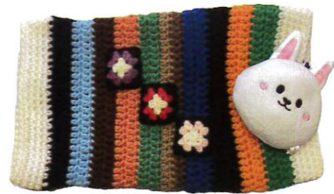
色合いも鮮やかで、かわいいマフが出来上がります！