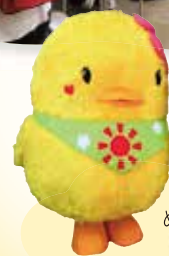
ぬくもりのマスコット ぬくっぴー