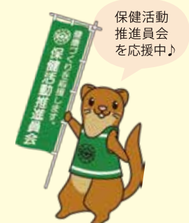
栄区いたち川マスコット タッチーくん

地域の健康づくりの推進役で、行政の健康づくり施策のパートナーです。健康づくりを自ら実践し、周囲の皆さんへ広め、地域全体で健康づくりに取り組めるよう活動しています。