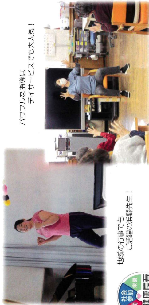
パワフルな指導は デイサービスでも大人気！

活動は月2回(第1・第3月曜日)のため、継続性というところでは少し弱いところがあります。 そのため、運動自体は特別なものではなく「日々の中のできる、簡単だけど効果的な運動」を中心に、健康に関する情報もあわせてお伝えしております。 最近ではコロナ禍での感染予防やフレイル予防などに加え、「人との交流から生まれる健康」とともに、変わりゆく状況とからの健康を維持していただける運動を目指して活動をしていきます。 ご興味を持たれた方は見学体験も行っておりますので、ぜひお立ち寄りください。